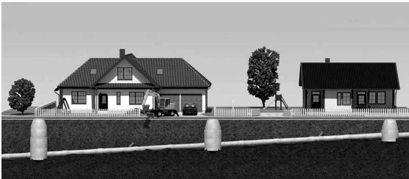
Традиционная самотечная канализация