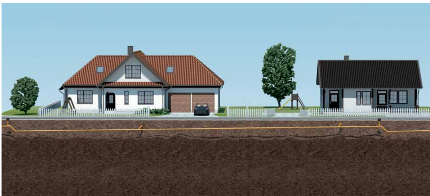
Вакуумная канализация Roediger®